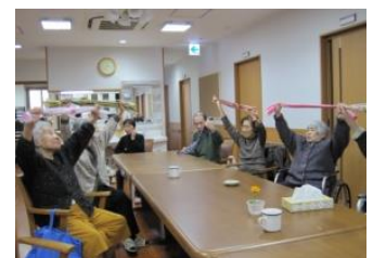
リフレッシュ体操

グループホームあいかではチームワーク・アットホームを大切に、楽しく不安のない生活を提供できることを目指し、全職員で日常生活をサポートさせていただきます。