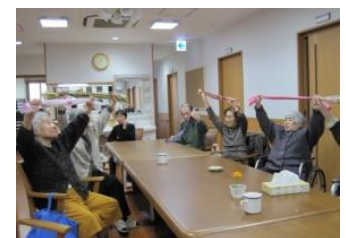
リフレッシュ体操

グループホームあいかではチームワーク・アットホームを大切に、楽しく不安のない生活を提供できることを目指し、全職員で日常生活をサポートさせていただきます。