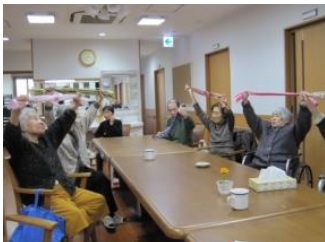
リフレッシュ体操

グループホームあいかではチームワーク・アットホームを大切に、楽しく不安のない生活を提供できることを目指し、全職員で日常生活をサポートさせていただきます。