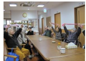
リフレッシュ体操

グループホームふれんどではチームワーク・アットホームを大切に、楽しく不安のない生活を提供できることを目指し、全職員で日常生活をサポートさせていただきます。