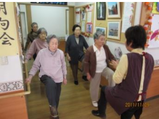
リフレッシュ体操

シニアホームあかねではチームワーク・アットホームを大切に、楽しく不安のない生活を提供できることを目指し、全職員で日常生活をサポートさせていただきます。