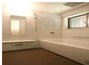
バリアフリーの浴室