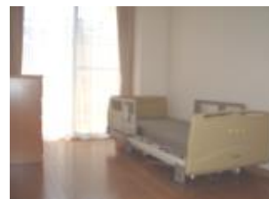
プライバシー配慮の個室