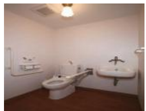
車イス対応のトイレ