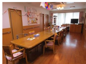
交流を楽しむリビング