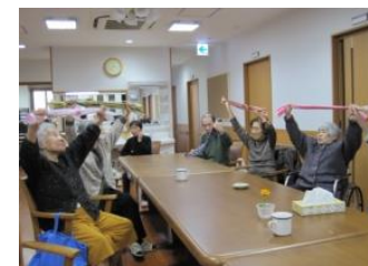
リフレッシュ体操

あいかではチームワーク・アットホームを大切に、楽しく不安のない生活を提供できることを目指し、全職員で日常生活をサポートさせていただきます。