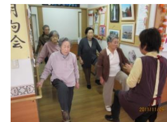
リフレッシュ体操

シニアホーム梅里ではチームワーク・アットホームを大切に、楽しく不安のない生活を提供できることを目指し、全職員で日常生活をサポートさせていただきます。